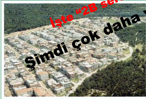
Şekil 5. Orman bütünlüğünü bozan yoğun yapılaşmış alanlar.