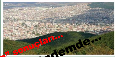
Şekil 6. Sultanbeyli'de yapılan orman içi yerleşmeler.