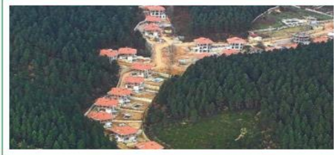
Şekil 4. Dere yatağı üzerindeki orman içi yerleşmeler.